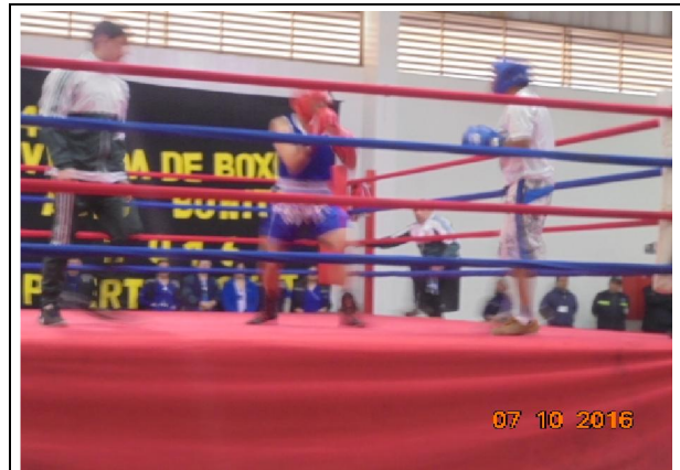
IMG. N° 003 Reinserción Social: Subprograma Deporte, Recreación, Arte y Cultural, EP Puerto Montt.

Comentario: Con fecha 07 de octubre de 2016, en dependencias del gimnasio de Complejo Penitenciario de Puerto Montt, se realiza evento deportivo "Jornada de Boxeo", donde participan internos seleccionados y deportistas de Club de Boxeo de Puerto Montt.