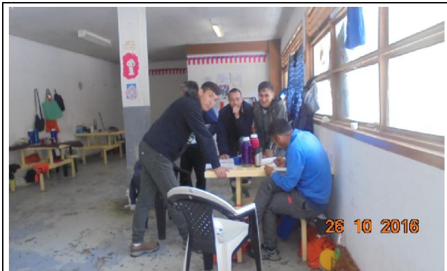
IMG. N° 002 Reinserción Social: Subprograma Educación, EP Valdivia

Comentario: Se fiscaliza inicio de proceso de exámenes de validación en módulos 21-22, 81-82, 43-44, 41-42, 31, 51-52 y 71. Dicho proceso cuenta con un total de 80 internos que rinden pruebas bajo esta modalidad de estudios.