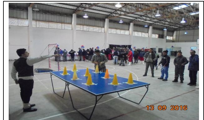
IMG. N° 002 Reinserción Social: Subprograma Deporte, Recreación, Arte y Cultural, EP Puerto Montt.

Comentario: Con fecha 13-09-2016, se fiscaliza el inicio de Evento de Fiestas Patrias para Trabajadores dependientes a cargo del Sub Programa de Deporte Recreación Arte y Cultura la actividad es dirigida por Profesores de Educación Física. Respecto a la participación de los internos se fiscaliza lista de asistencia de participantes pertenecientes a los módulos 11-12, 21, 32, 41-43, 51-52, 54, se aprecia presencia de funcionarios de Gendarmería custodiando la seguridad de los profesionales y el funcionamiento de la actividad.