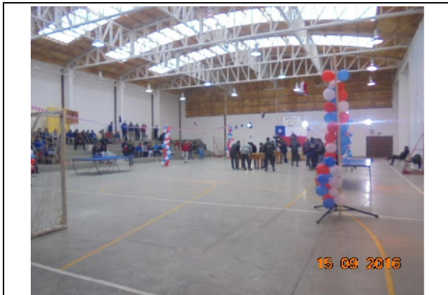
IMG. N° 003 Reinserción Social: Subprograma Educación, EP Valdivia

Comentario: Con fecha 15-09-2016 se fiscalizan las actividades recreativas efectuadas por el Establecimiento Educacional Liceo Coresol, estas iniciativas se enmarcan en las festividades de fiestas patrias y cuentan con la participación internos inscritos en las distintas modalidades educativas.