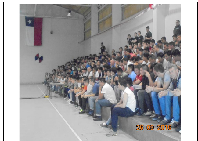
IMG. N° 001 Reinserción Social: Subprograma Deporte, Recreación, Arte y Cultura, EP. Santiago 1

Comentario: El día lunes 26-09-16 se realizó evento cultural "Armadillo", con la asistencia de los módulos 35 y 36; lo cual implica la participación de 272 imputados.