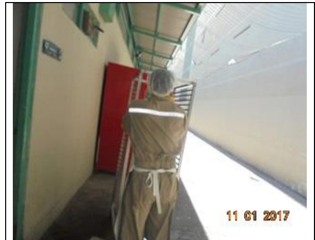
IMG. N° 001 Reinserción Social: Subprograma Laboral.

Comentario: En el marco del subprograma Laboral, los imputados pueden acceder a ser contratados como auxiliares de aseo o reposteros por la Sociedad Concesionaria. La imagen muestra a auxiliar repostero desarrollando sus funciones.