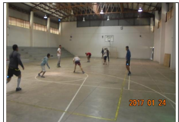
IMG. N° 003 Reinserción Social: Subprograma Deporte, Recreación, Arte y Cultural, EP Puerto Montt.

Comentario: El día 23.01.2017 se dio inicio a talleres 2017 en DRAC y Sub programa Psicológico y Social.