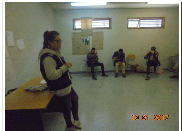
IMG. N° 002 Reinserción Social: Subprograma Capacitación Laboral.

Comentario: Se fiscaliza inicio de 12 Cursos de Capacitación en Oficio año 2017, los cuales cuentan con un total de 234 internos aprobados formalmente con Consejo Técnico.