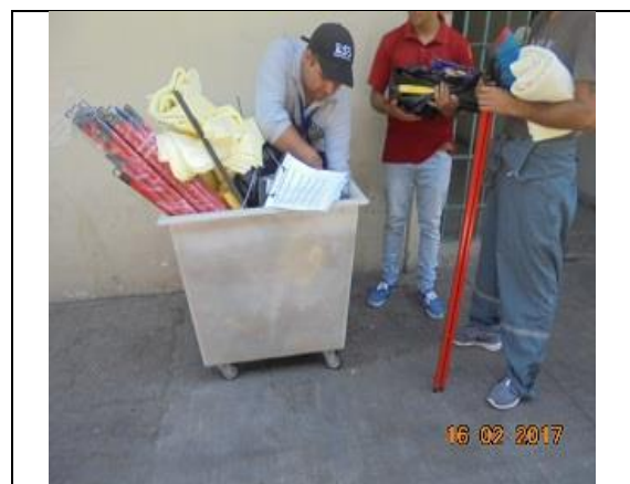
IMG. N° 001 Reinserción Social: Subprograma Laboral.

Comentario: En el marco del subprograma Laboral, los imputados pueden acceder a ser contratados como auxiliares de aseo o reposteros por la Sociedad Concesionaria, donde se les hace entrega de implementos de protección personal, así como materiales de aseo.