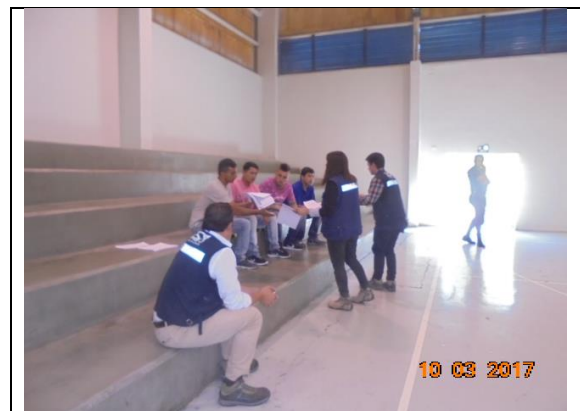
IMG. N° 001 Reinserción Social: Subprograma Laboral.

Comentario: En el marco del subprograma Laboral, los imputados pueden acceder a ser contratados como auxiliares de aseo o reposteros por la Sociedad Concesionaria, donde previo a su contratación reciben charlas de inducción y capacitación, actividad que es la que se muestra en la fotografía para auxiliares de aseo.