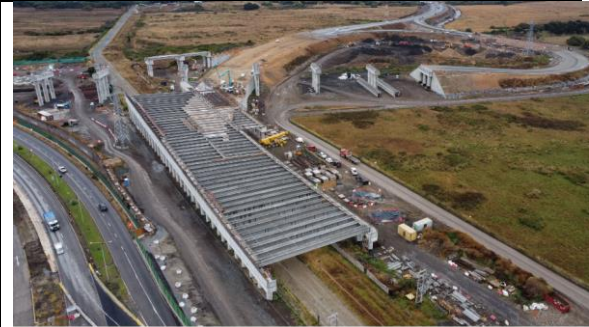
Vista General - Sector A