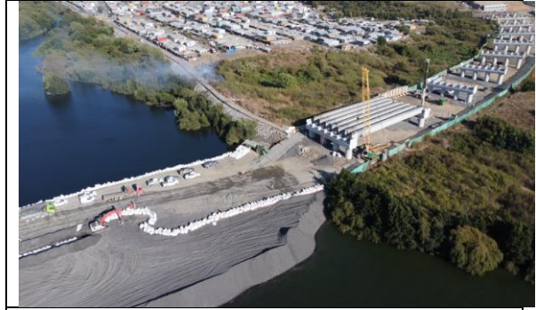
Vista Puente Industrial desde San Pedro