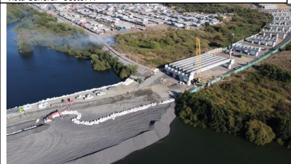
Pilotes Sector C San Pedro