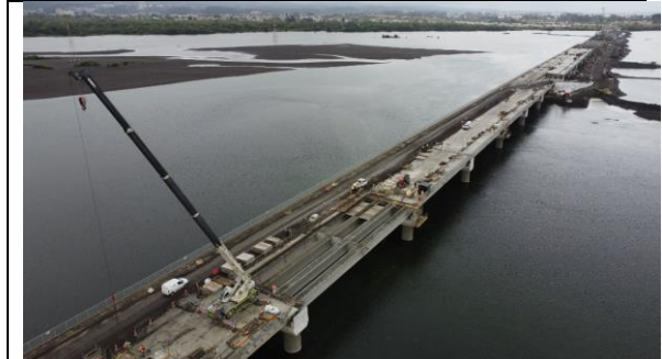
Vista Puente Industrial-Hualpen