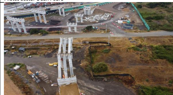
P. Superior ENAP-Sector A