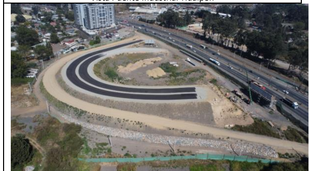
Enlace Sector C