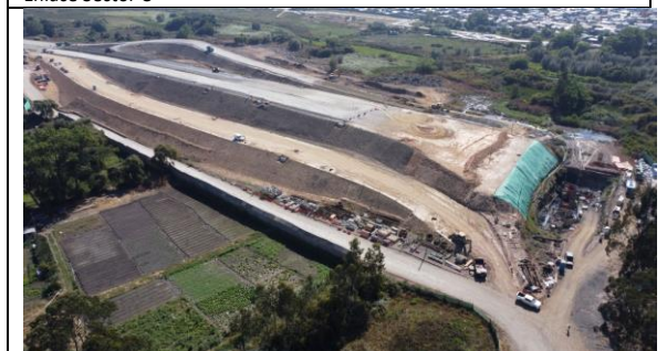
Terraplén Ejes 13, 14, 15 y troncal- Sector C