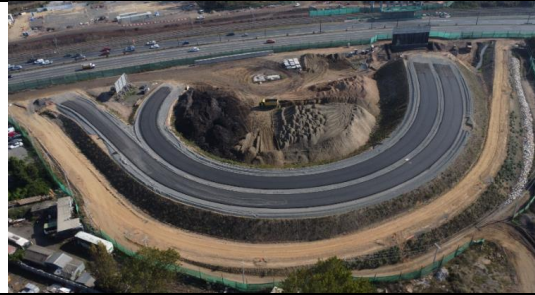
Vista General Lazo Sector C