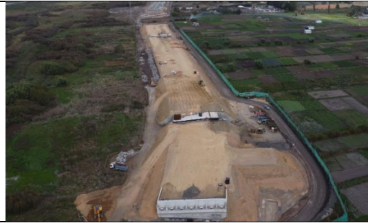
Vista PI desde Estribo de Salida