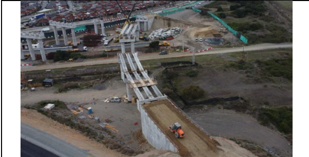
Paso Superior ENAP