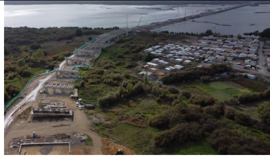
Vista P.Industrial desde Estribo de Salida