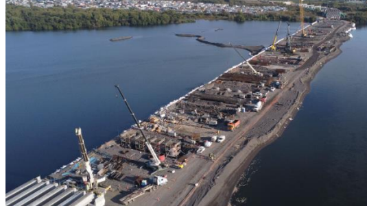
Vista P.Industrial desde Cepa 32