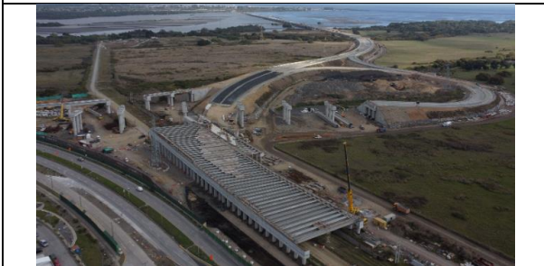
Vista General Sector A