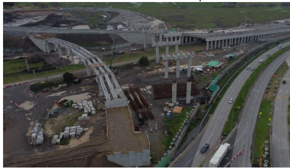
Paso Superior ENAP