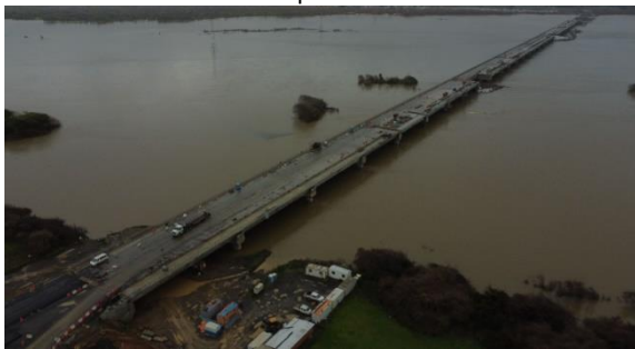
Vista Puente Industrial Hualpén