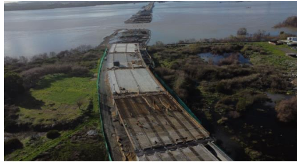
Vista P. Industrial desde Estribo de Salida