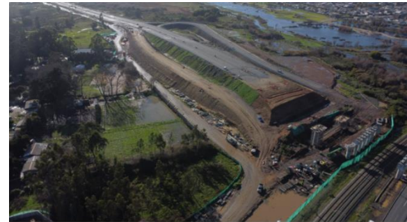
Terraplén Ejes 13, 14, 15 y troncal Sector C(R160)