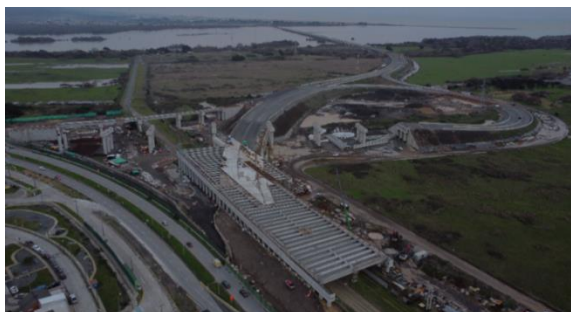
Vista General Sector A