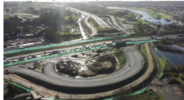
Vista General Lazo Sector C