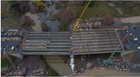
Puente Bocatoma - Hualpén