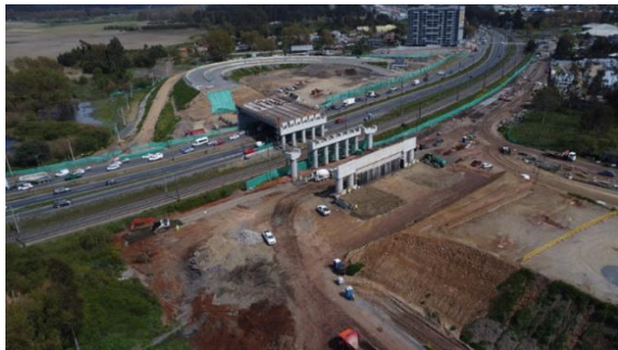
Paso superior Los Batros – San Pedro de la Paz