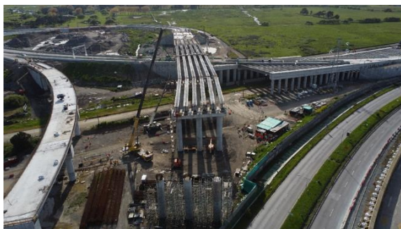
Costanera – Hualpén (vista aérea)