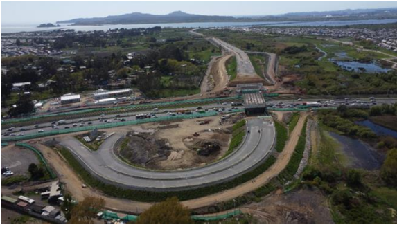
Vista aérea sector C – San Pedro de la Paz