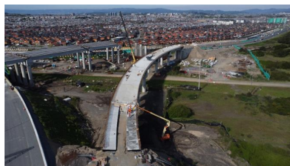
Paso Superior ENAP - Hualpén