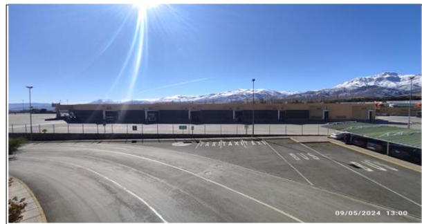
4. Ingreso recinto