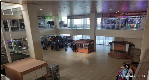
1. Zona de Servicios