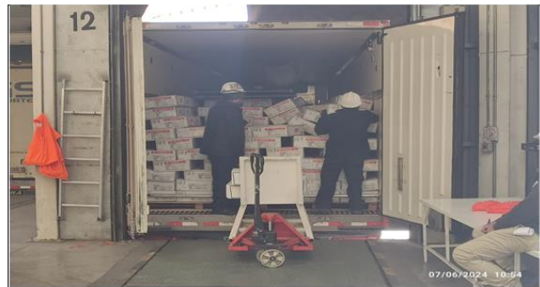
6. Zona Inspección