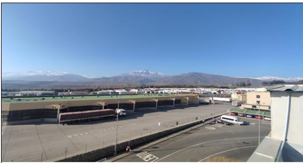
5. Área de Andenes