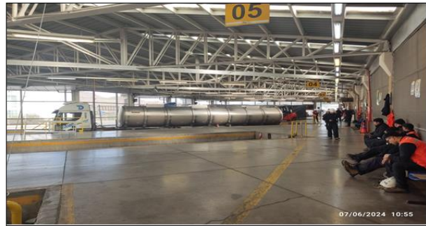
2. Inspección de Carga