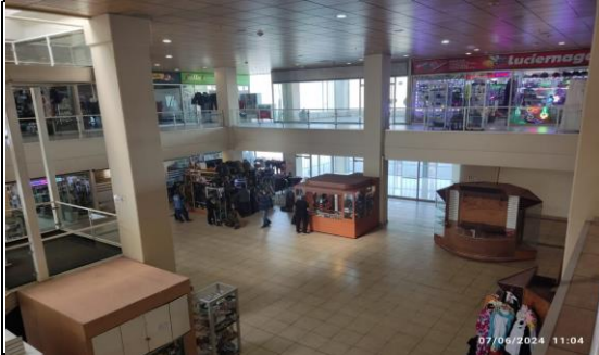
1. Zona de Servicios