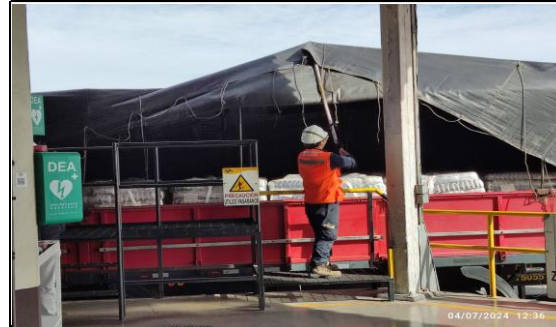
2. Inspección de Carga