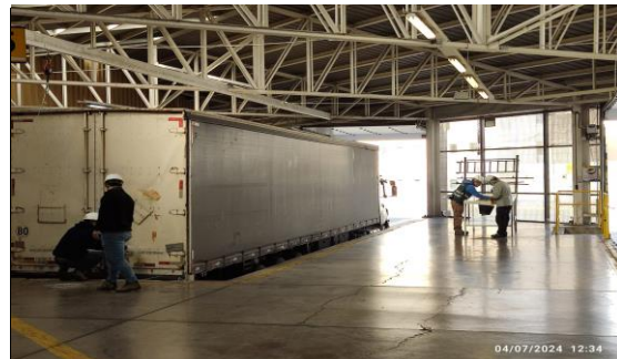
6. Zona Inspección