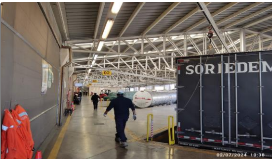
5. Área de Andenes