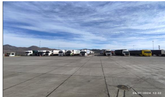
4. Ingreso recinto