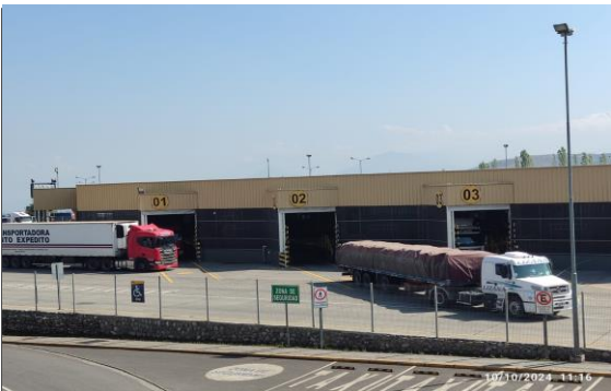
5. Área de Andenes