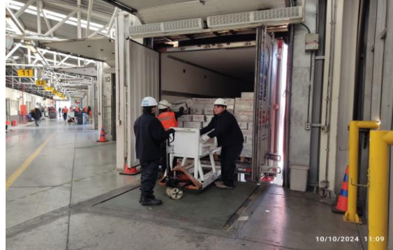
2. Inspección de Carga