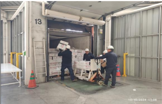
3. Revisión de Carga