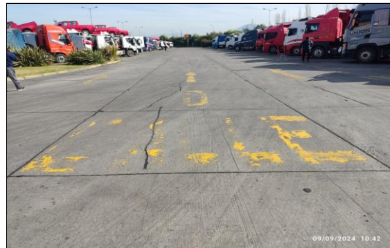
4. Ingreso recinto