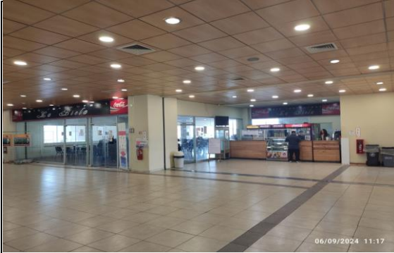
1. Zona de Servicios