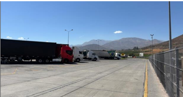
5. Área de Parquadero