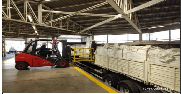
2. Inspección de Carga