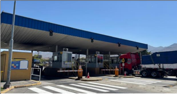
3. Revisión de Ingreso