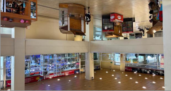
1. Zona de Servicios