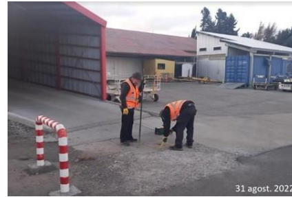
Revisión y mantenimiento de cámaras.