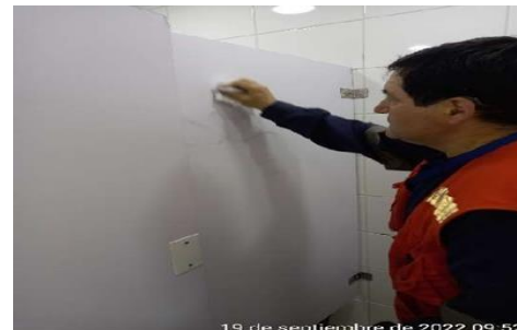
19 de septiembre de 2022 09:52 Mantención Muros