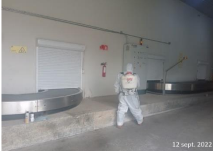
Fumigación áreas Terminal BBA.