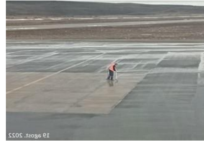
Limpieza Estacionamientos Plataforma