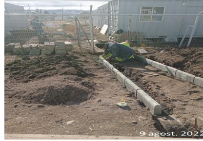
Construcción Pasarela a Container IF.