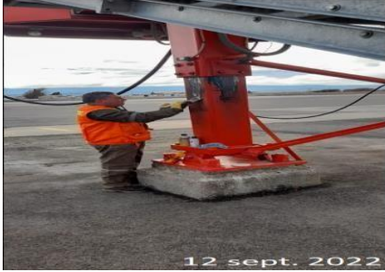
Mantenimiento Puentes de Embarques