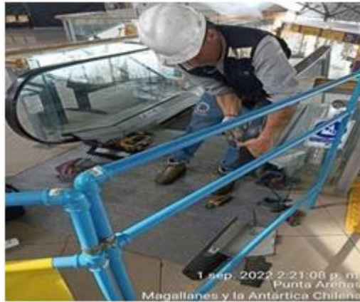
Mantenimiento escalera metálica