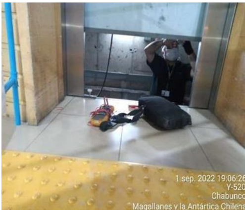
Mantenimiento correctiva Ascensor