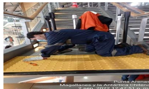
Punta Arenas Magallanes y la Antártica Chilena 2 sep. 2022 12:42:51 p. m. Mantención pisos