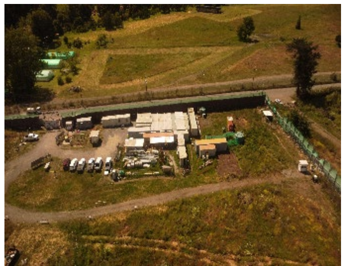
Terreno del Hospital de Coronel, con cerramiento perimetral.