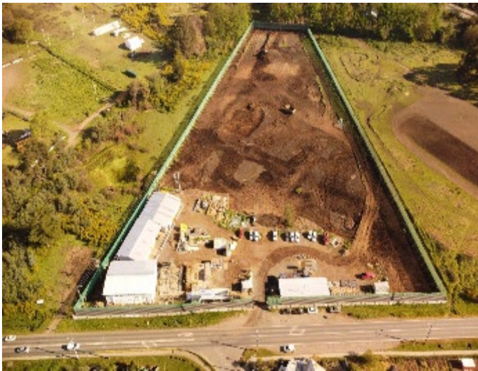
Terreno. Hospital de Santa Bárbara. Escarpe y Cerramiento perimetral