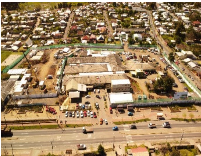
Cerramiento perimetral en el terreno del Hospital de Nacimiento