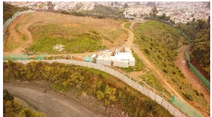
Terreno del Hospital de Lota, cerramiento perimetral.