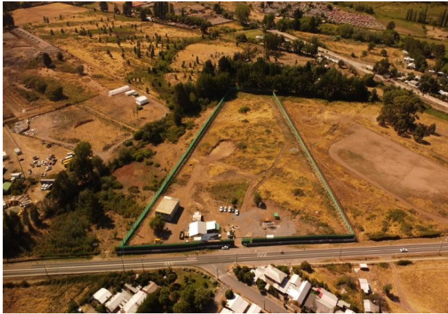
Terreno. Hospital de Santa Bárbara. Cerramiento perimetral

Terreno del Hospital e Lota. Cerramiento perimetral.