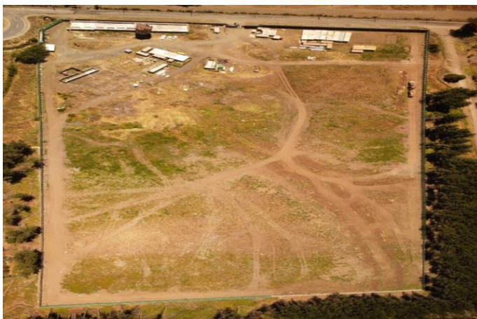
Terreno del Hospital de Coronel, con cerramiento perimetral.