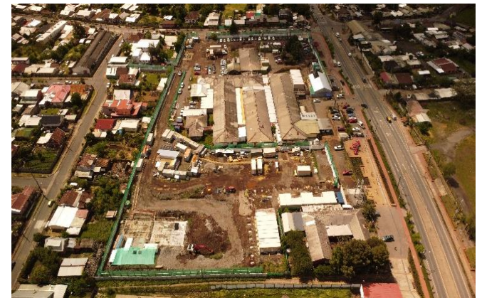
Sector Excavación Fundación Hospital de Día y Sala Cuna