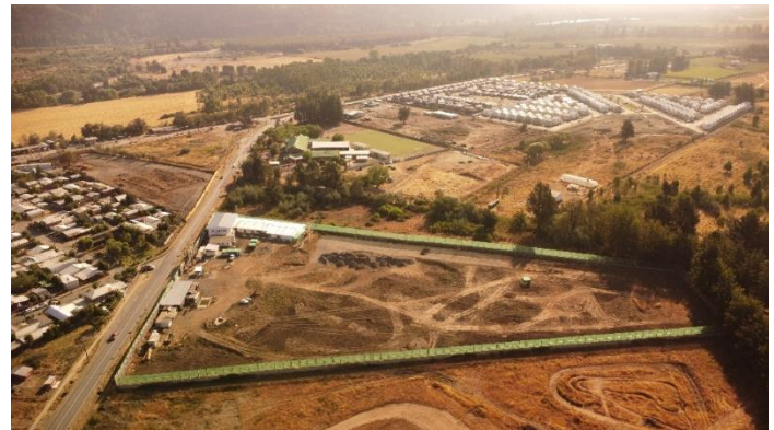
Vista aérea General HSB