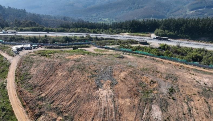
Vista aérea hacia acceso Oeste