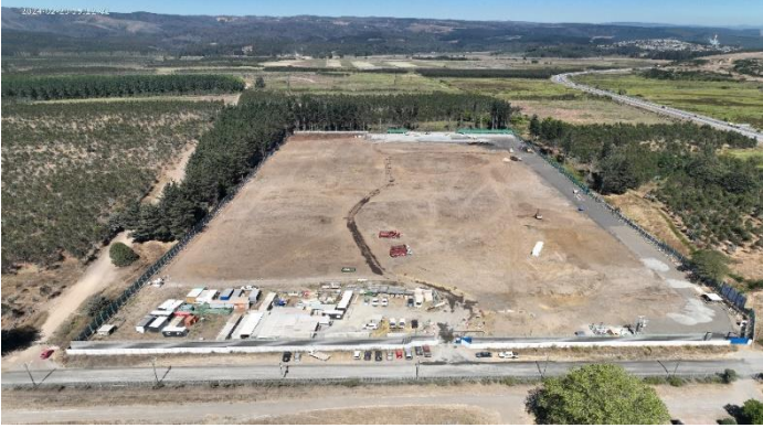
Vista aérea rellenos acceso, oficinas OHLA-IF, escarpe general