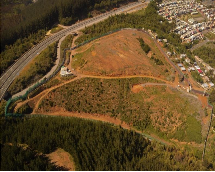
Terreno del Hospital de Lota, cerramiento perimetral.