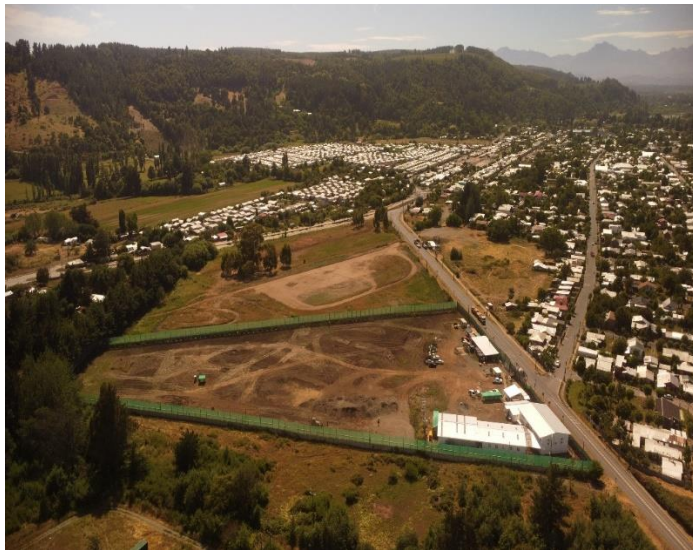
Terreno. Hospital de Santa Bárbara. Escarpe y Cerramiento perimetral