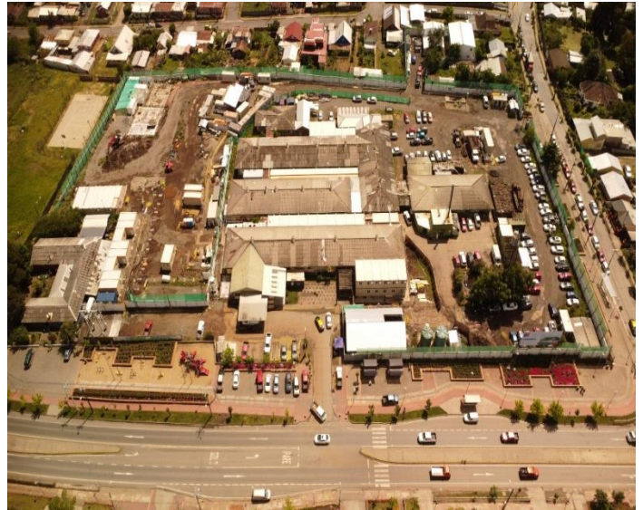
Cerramiento perimetral en el terreno del Hospital de Nacimiento