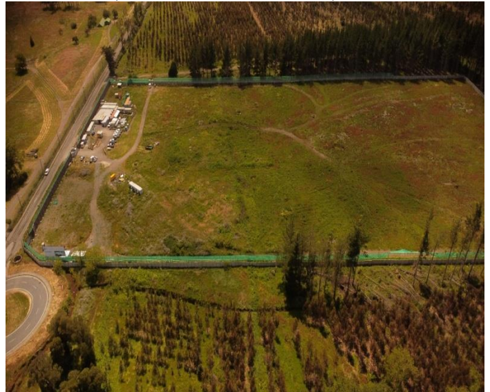
Terreno del Hospital de Coronel, con cerramiento perimetral, escarpe e instalación de fauna provisoria