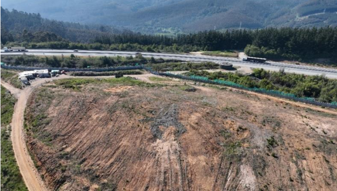
Vista aérea hacia acceso Oeste