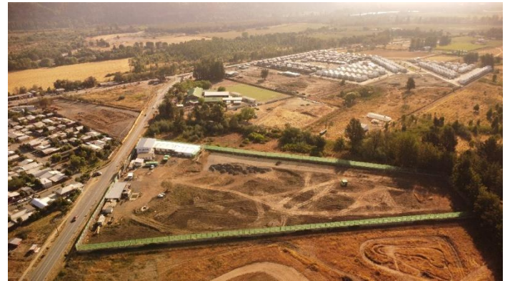
Vista aérea General HSB