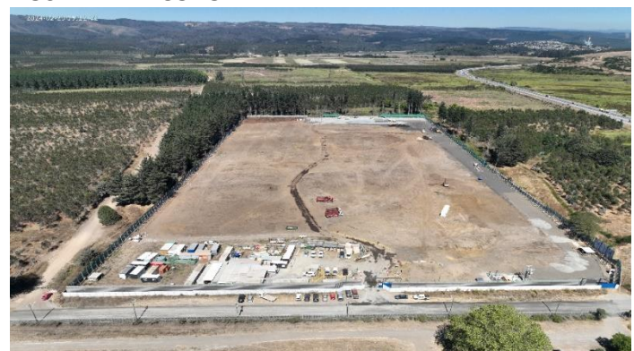
Vista aérea rellenos acceso, oficinas OHLA-IF, escarpe general