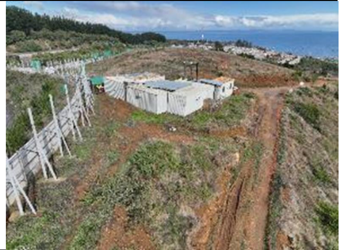
Vista aérea hacia acceso Oeste. Hospital de Lota.