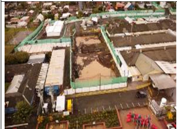
Sector Excavación Fundación Hospital de Día y Sala Cuna. Hospital de Nacimiento