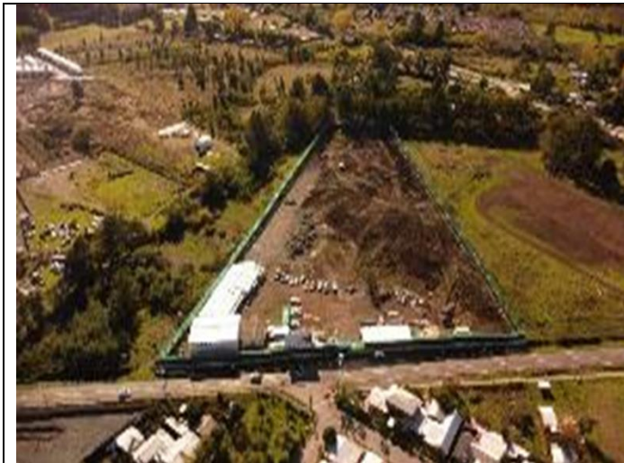
Vista aérea General Hospital de Santa Bárbara