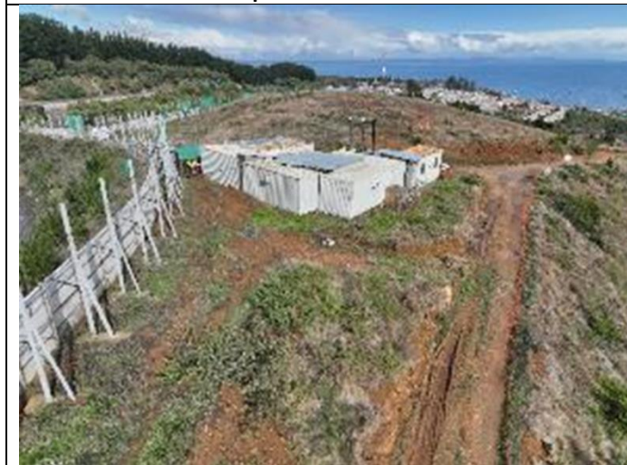
Vista aérea hacia acceso Oeste. Hospital de Lota.