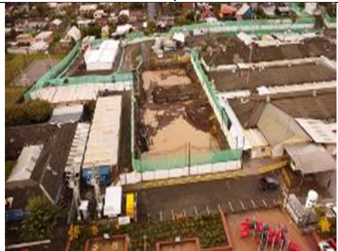
Sector Excavación Fundación Hospital de Día y Sala Cuna. Hospital de Nacimiento