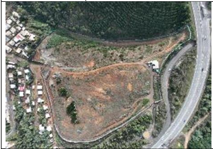
Vista aérea hacia acceso Oeste. Hospital de Lota.