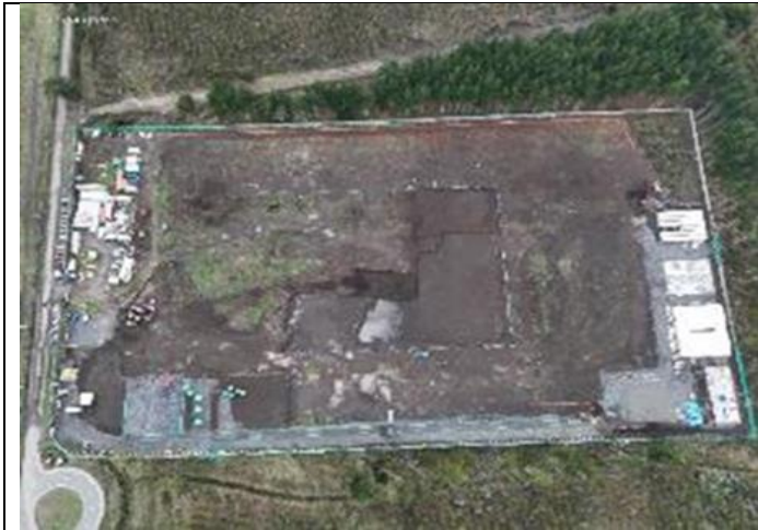
Vista aérea acceso, oficinas OHLA-IF, escarpe general. Hospital de Coronel