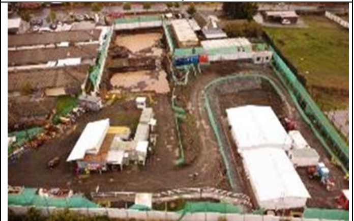
Sector Excavación Fundación Hospital de Día y Sala Cuna. Hospital de Nacimiento