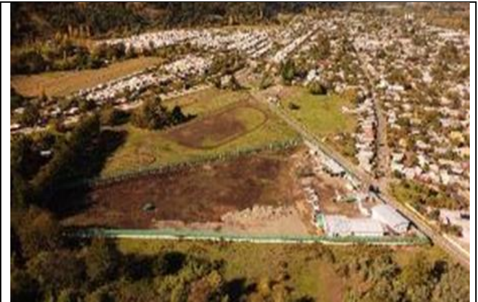
Vista aérea General Hospital de Santa Bárbara