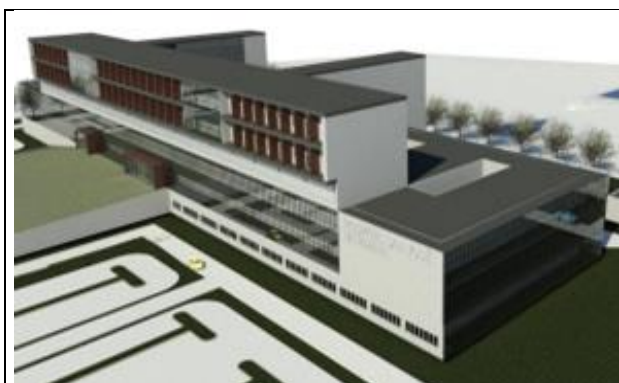
Hospital de Parral: Camino a Catillo 420, ruta L-128, comuna de Parral, Provincia de Linares, Región del Maule