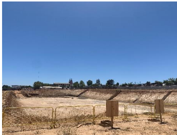
Excavaciones masivas Sectores Poniente