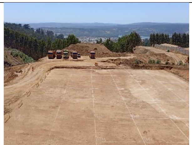
movimiento de tierra