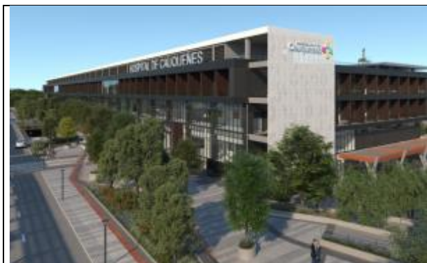
Hospital de Cauquenes: Yungay 1111, Comuna de Cauquenes, Provincia de Cauquenes, Región del Maule

A partir de las coordenadas señaladas en el art. 2.2 del Anexo Complementario de las Bases Técnicas de las Bases de Licitación, se define el área de concesión para cada hospital.