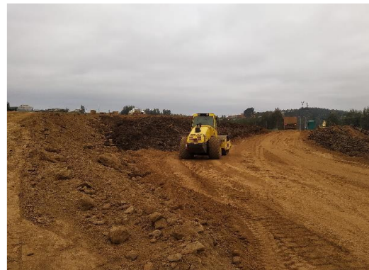
FIG 9: Excavaciones.