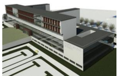
Hospital de Parral: Camino a Catillo 420, ruta L-128, comuna de Parral, Provincia de Linares, Región del Maule