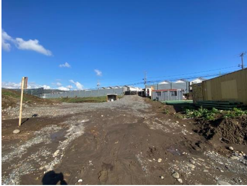
FIG 10: Excavaciones.