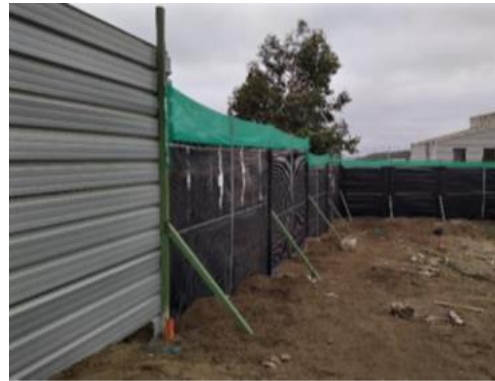
FIG 4: Cercado provisorio.