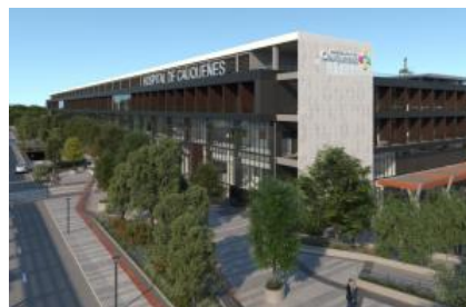
Hospital de Cauquenes: Yungay 1111, Comuna de Cauquenes, Provincia de Cauquenes, Región del Maule

El lugar de emplazamiento de cada hospital estará ubicado en las ciudades de Cauquenes, Constitución y Parral.