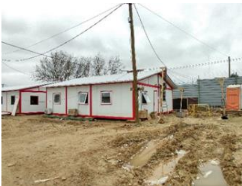
FIG 2: Cercado provisorios.