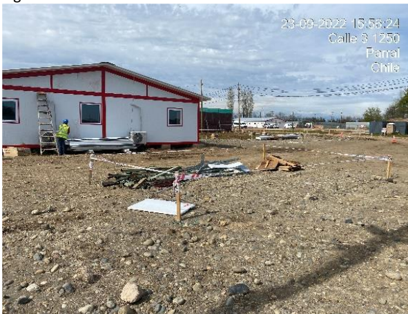
Figura N°8: acceso provisorio