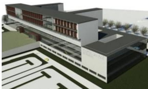
Hospital de Parral: Camino a Catillo 420, ruta L-128, comuna de Parral, Provincia de Linares, Región del Maule