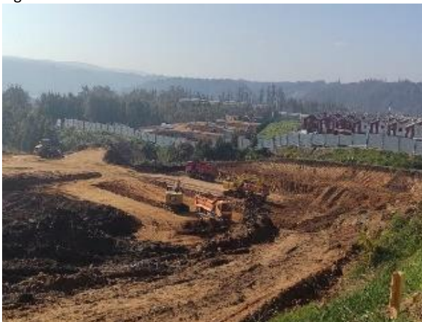
Figura N°6: Excavaciones Masivas