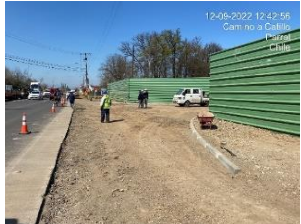
Figura N°9: excavaciones masivas