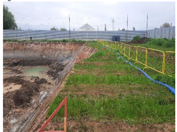
Figura N°9: excavaciones masivas