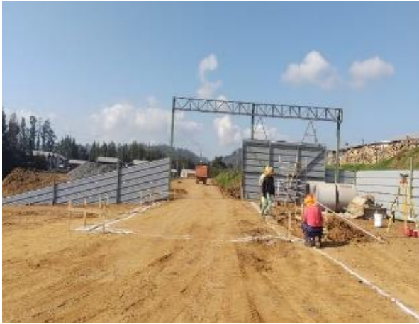
Figura N°5: Cercado provisorio