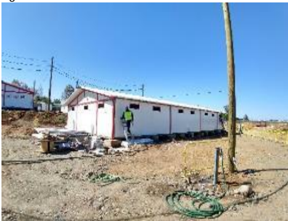
Figura N°1: Instalación de Faena