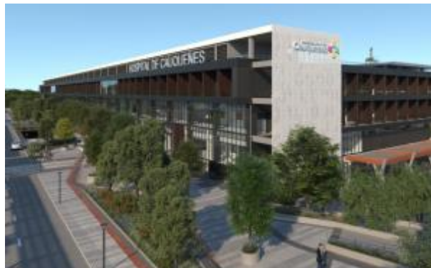
Hospital de Cauquenes: Yungay 1111, Comuna de Cauquenes, Provincia de Cauquenes, Región del Maule

A partir de las coordenadas señaladas en el art. 2.2 del Anexo Complementario de las Bases Técnicas de las Bases de Licitación, se define el área de concesión para cada hospital.