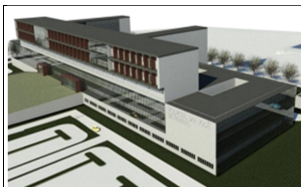
Hospital de Parral: Camino a Catillo 420, ruta L-128, comuna de Parral, Provincia de Linares, Región del Maule