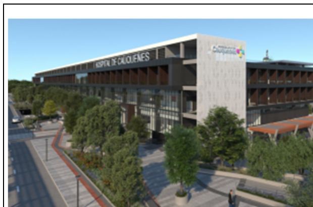
Hospital de Cauquenes: Yungay 1111, Comuna de Cauquenes, Provincia de Cauquenes, Región del Maule

A partir de las coordenadas señaladas en el art. 2.2 del Anexo Complementario de las Bases Técnicas de las Bases de Licitación,