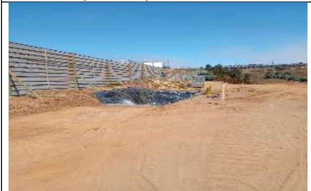
Piscina implementada para lavado de canoa Mixer

Manejo, control y traslado de materiales de tierra resultante de las excavaciones.