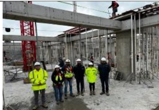
Trabajadores con sus EPP