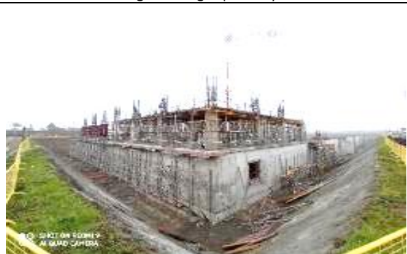
Enfierradura de capiteles y losa