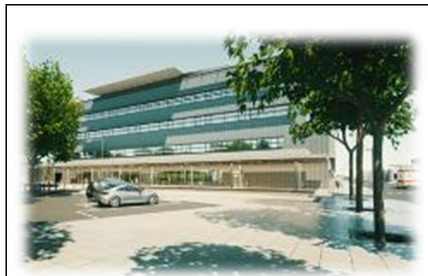
Hospital de Cauquenes: Yungay 1111, Comuna de Cauquenes, Provincia de Cauquenes, Región del Maule

A partir de las coordenadas señaladas en el art. 2.2 del Anexo Complementario de las Bases Técnicas de las Bases de Licitación, se define el área de concesión para cada hospital.