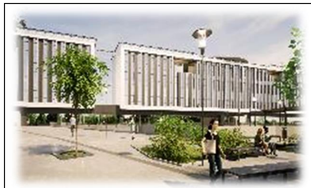
Hospital de Parral: Camino a Catillo 420, ruta L-128, comuna de Parral, Provincia de Linares, Región del Maule