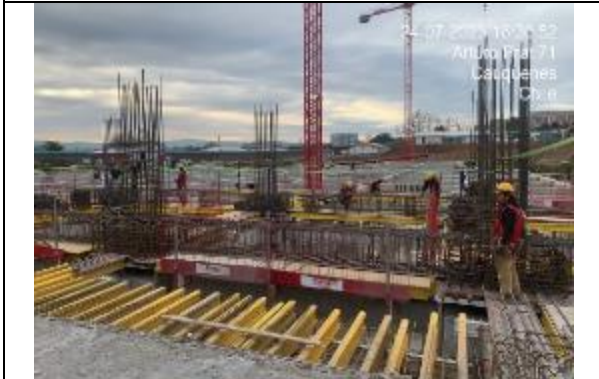
Trabajos de obra gruesa en nivel -1