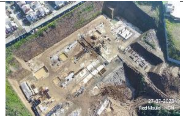
enfierraduras y hormigonado para fundaciones para Grúa