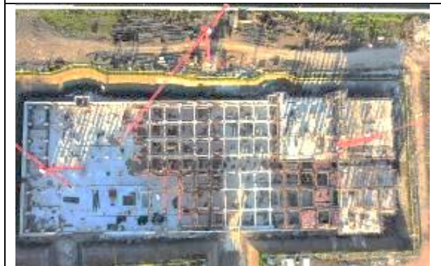
enfierradura y moldaje de viga