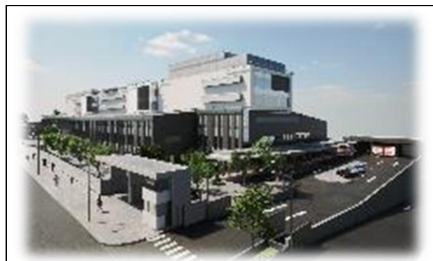
Hospital de Constitución: Calle Río Maule s/n, comuna de Constitución, Provincia de Talca, Región del Maule