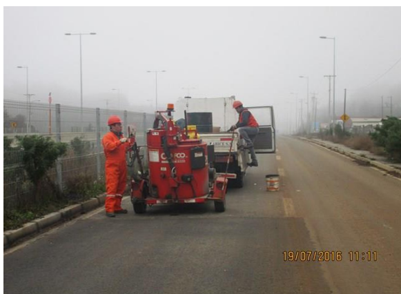
Sello de juntas en reparaciones de baches, Eje 5 y Eje 8, sector Cerro Alto.