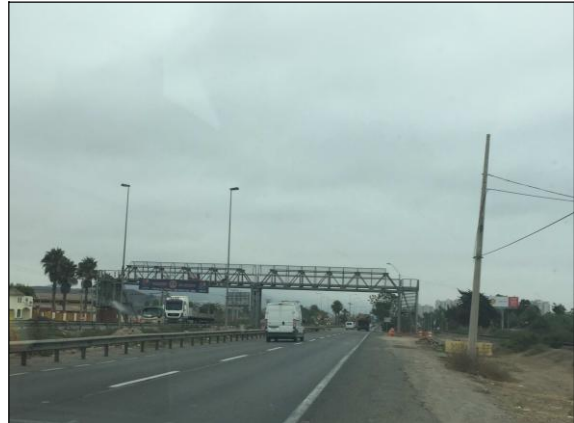
Pasarela Peatonal Colegio Adventista

Adicionalmente, se encuentra en desarrollo los trabajos de topografía, mecánica de suelos y el diseño vial para el tramo urbano del proyecto de ingeniería, en particular la definición del eje.