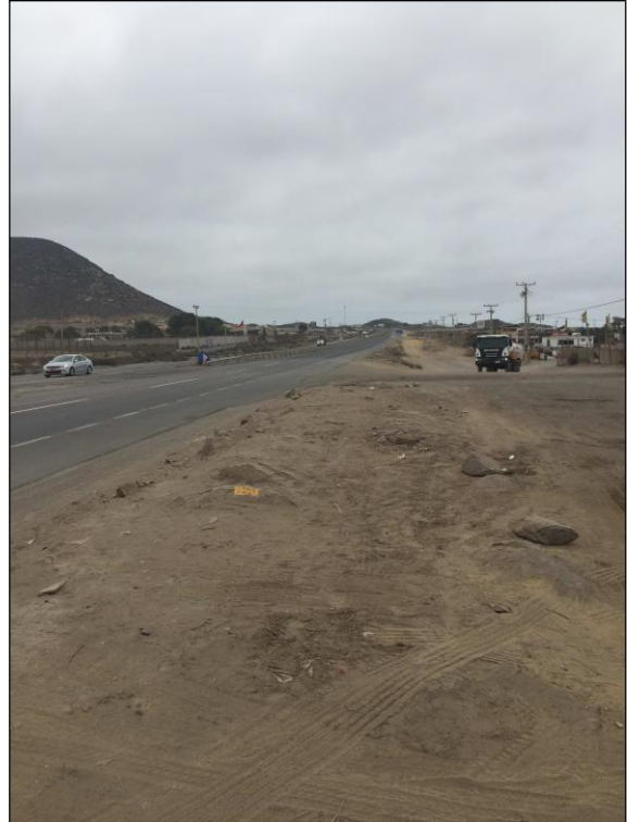
Ruta 5, sector Ingreso a Coquimbo desde el Sur.