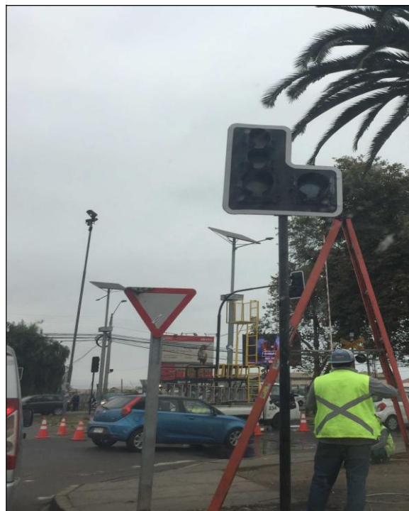
Ruta 5, Francisco de Aguirre, I.M. La Serena repara semáforos