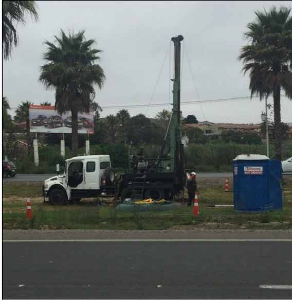
Trabajos de Sondajes por la SC