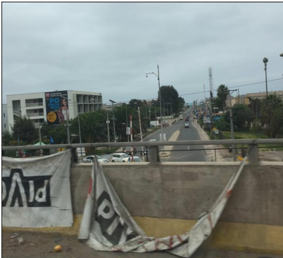
Desnivel existente Ruta 5, sector J.A.Ríos