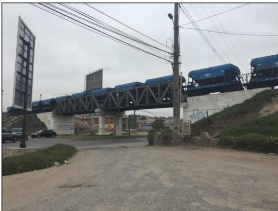
Cruce Ferroviario Ruta 5