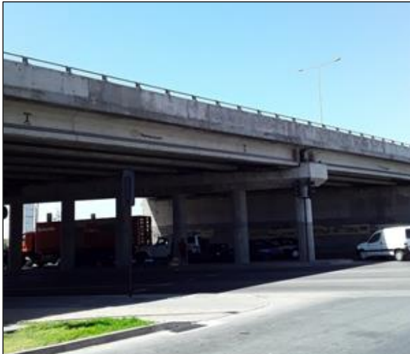
Ruta 5, Dm 463+800 P. S. La Cantera