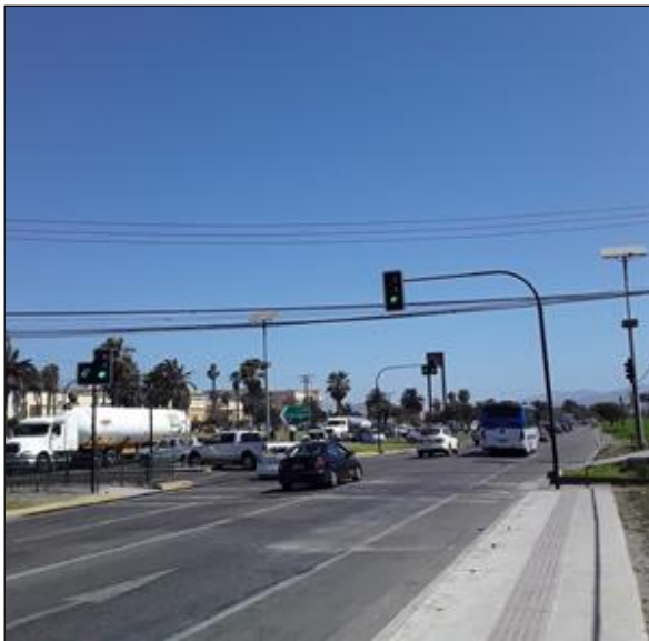
Ruta 5, Dm 472+200 Semáforos Amunátegui en operación.