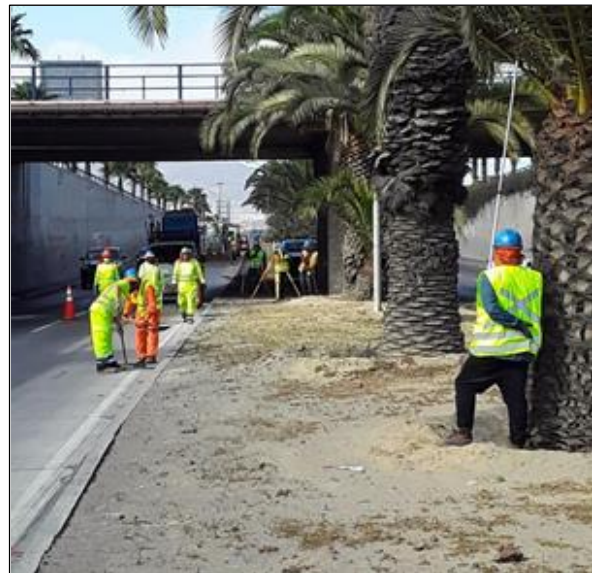
Ruta 5, Dm 461+600 Labores de Topografía