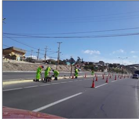
Ruta 5, Dm 458+500 Limpieza de la faja