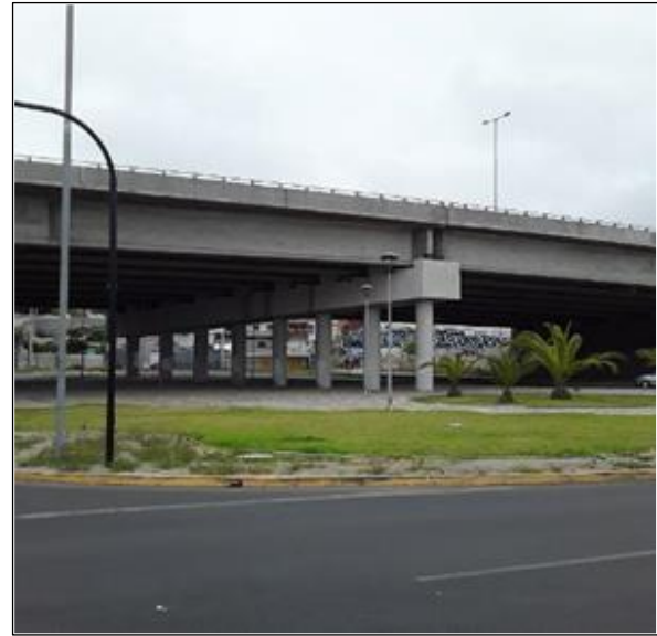
Ruta 5, Dm 462+300 P. S. Juan Antonio Ríos