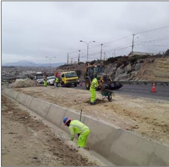
Ruta 5, Dm 457+900 Limpieza de la faja