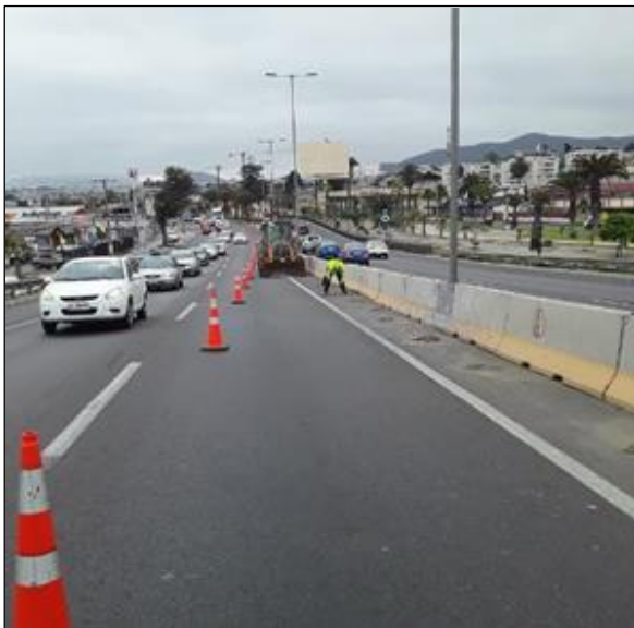
Ruta 5, Dm 462+500 Obras de Mantenimiento