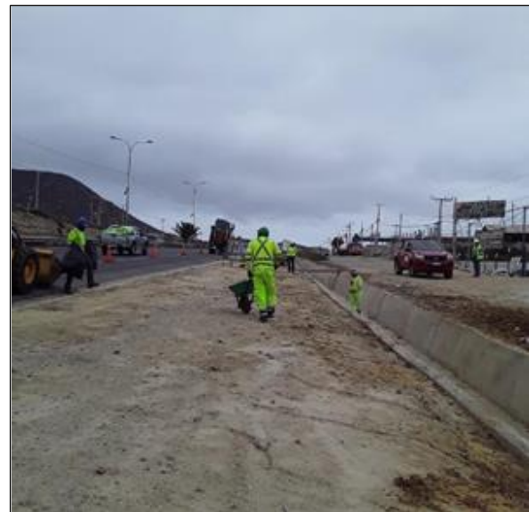
Ruta 5, Dm 457+900 Trabajos en la Faja