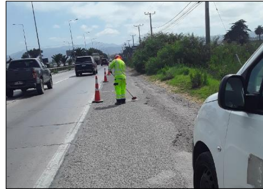
Ruta 5, Dm 470+700 Limpieza de Faja.

No hay conflictos que mencionar en el periodo