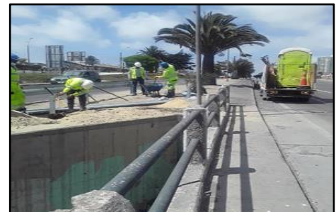
Ruta 5, Dm 459+200 Instalación Defensas camineras