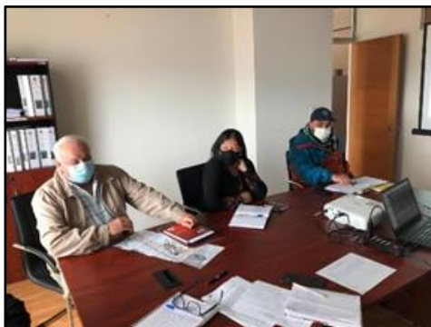
Reunión informativa de situación de avance del proyecto e inquietudes vecinos del sector Vegas Sur, La Serena.