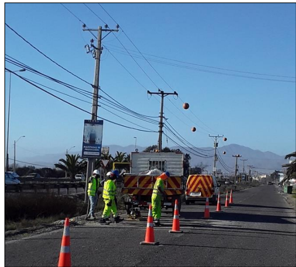
Ruta 5, Dm 470+000 Reparación de pavimento.