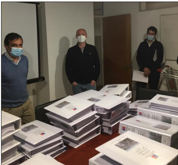
12-Ago.: Entrega versión A Otros Proyectos TU sector 2.