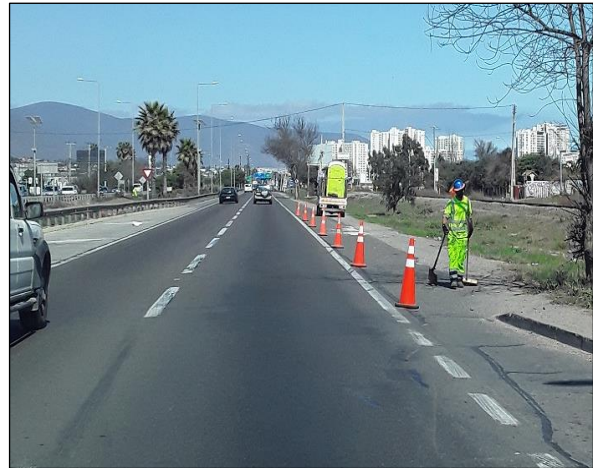
Ruta 5, Dm 468+500 Limpieza de la faja.