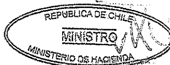
FELIPE LARRAÍN BASCUÑÁN Sr. Ministro de Hacienda