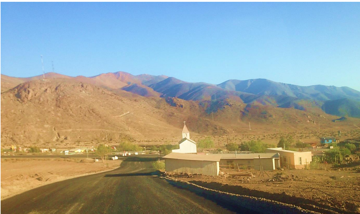
* Acceso desde desvío a localidad de Incahuasi (vista desde Ruta 5).