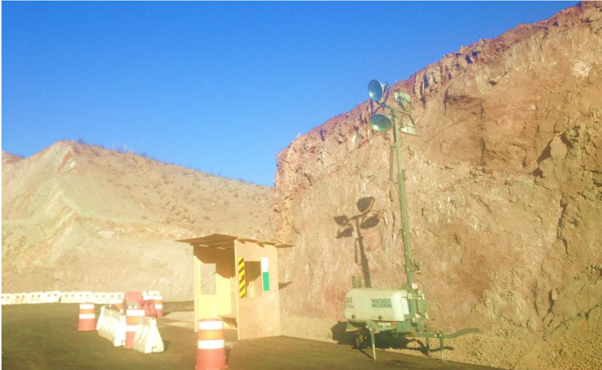
* Paradero provisorio Variante Incahuasi Poniente.