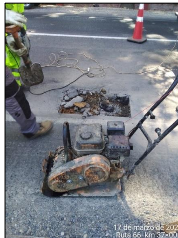
Trabajos de bacheo, sector Codao