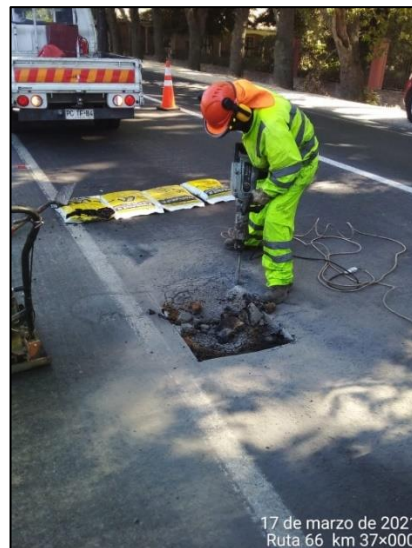
Trabajos de bacheo, sector Codao