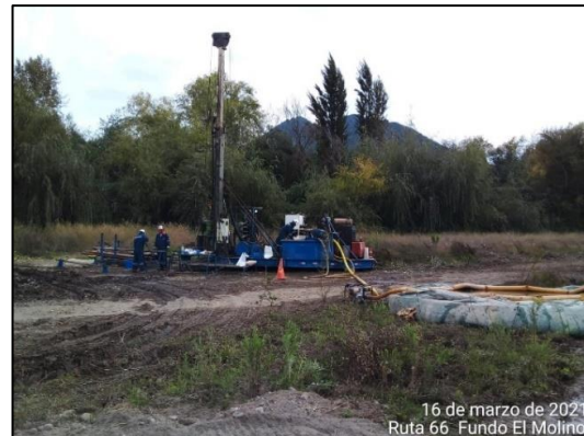
Trabajos de sondajes