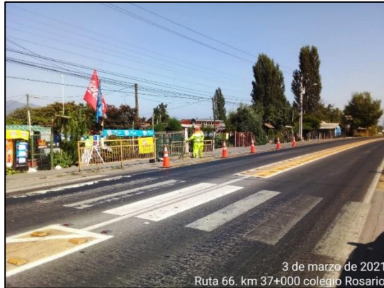
Trabajos de instalación de vallas peatonales