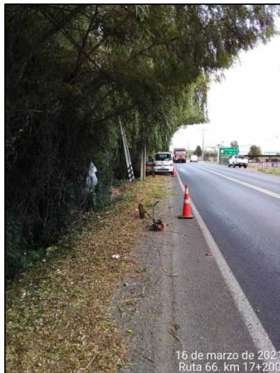
Trabajos de roce y despeje, comuna de San Vicente