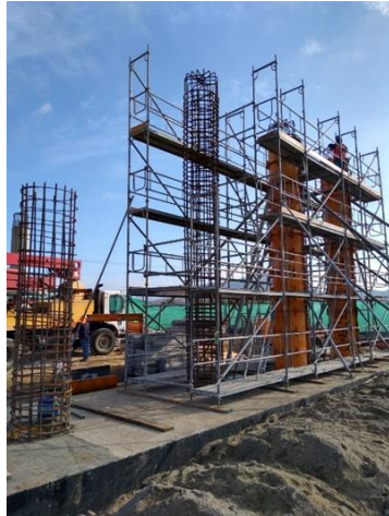
Trabajos en columnas Paso Superior Las Arañas Poniente