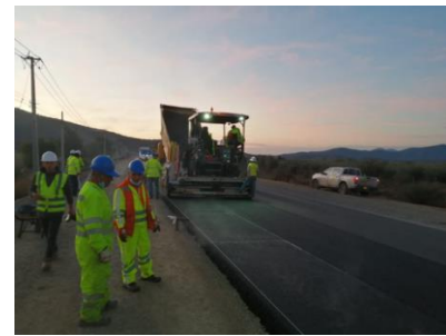
Colocación asfáltico capa intermedia Dm 77.000