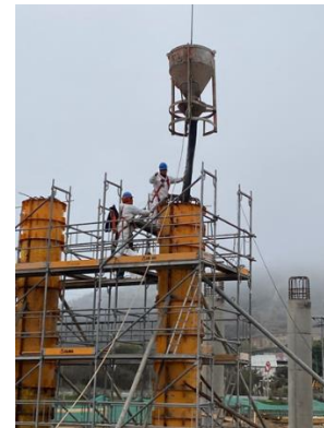
Hormigonado columnas Pasarela San Vicente Dm 76.800