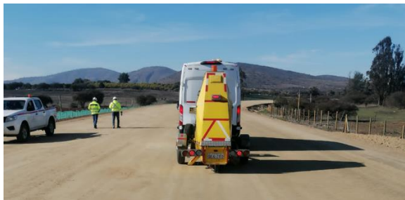
Toma de Deflectometría en Variante Quincanque,