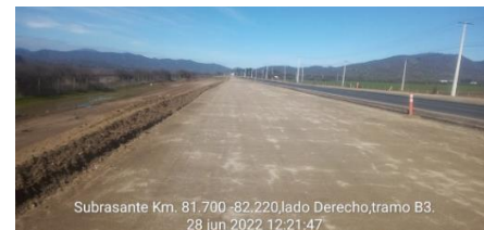
Subrasante Km. 81.700 -82.220, lado Derecho, tramo B3. 28 jun 2022 12:21:47