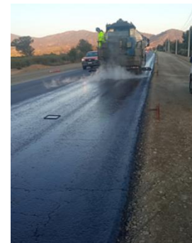
Riego de Liga Dm 77.000 a 82.000