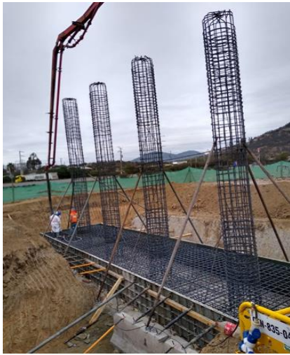
Trabajos en Paso Superior Las Arañas Oriente