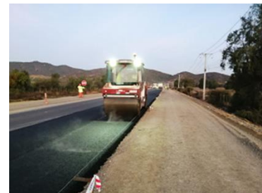
Concreto asfáltico capa intermedia Dm 77.000 a 82.000