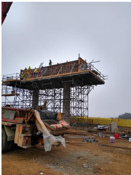
Trabajos en Paso Inferior Rapel