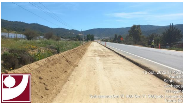
Subrasante, DM 71.460