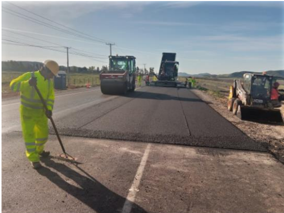
Concreto asfáltico de rodadura, DM 82.560-84.340