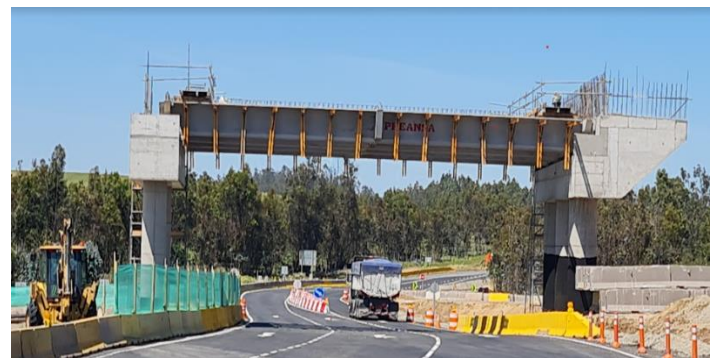
Paso Inferior Rapel, DM 116.950