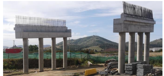
PS Las Arañas Poniente, DM 92.672