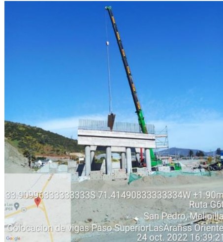
PS Las Arañas Oriente, DM 92.542