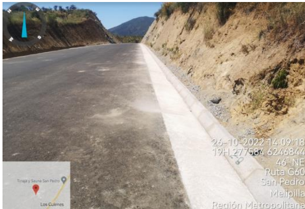
Variante Los Culenes