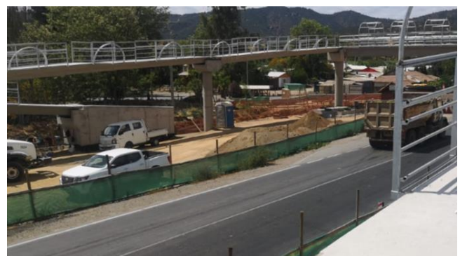
Pasarela Peatonal San Vicente, DM 76.800