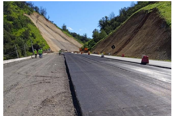
Dm 74.500 Vista Lateral Geogrilla Cuesta San Vicente