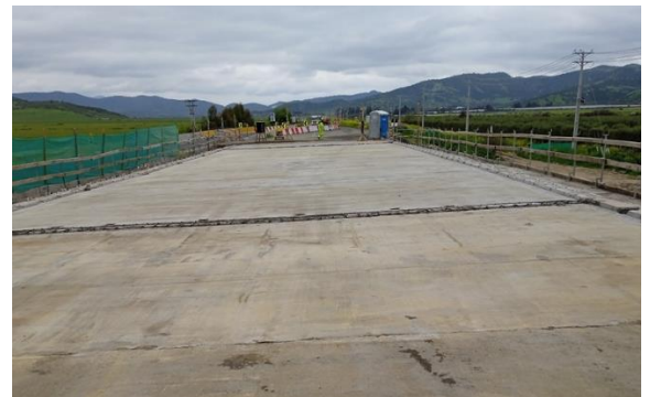
Dm 84.440 Puente La Cabaña