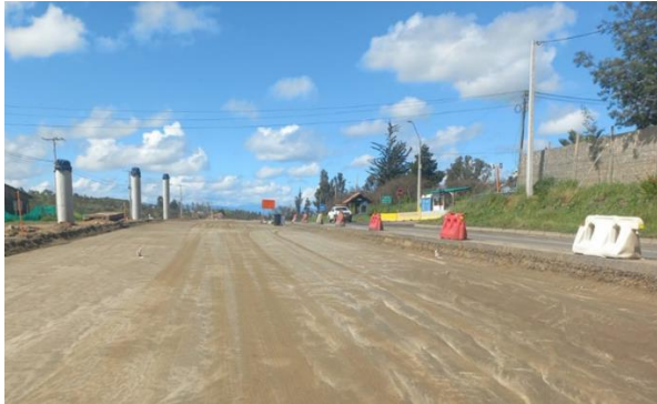
Dm 101.200 Tramo Subrasante Ruta Sector Quilamuta