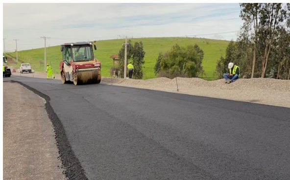
Dm 107.680 Pavimentación sector Cabimbao