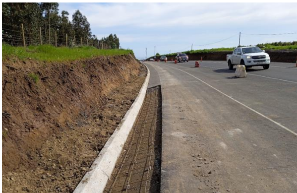
Dm 119.820 Cunetas Construidas y Sin Construir