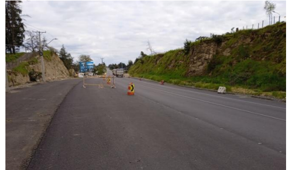
Dm 64.720 Ruta en la Proximidad del Puente El Durazno