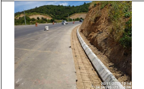
Dm 74.950 Pista Pavimentada Zona de Corte Bajada Cuesta San Vicente