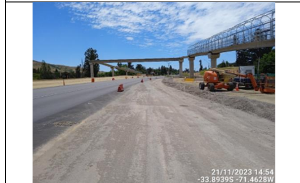
Dm 92.500 Panorámica Enlace Las Arañas

-33.9107S -71.4141W ByPass Ruta 60 San Pedro Región Metropolitana Chile