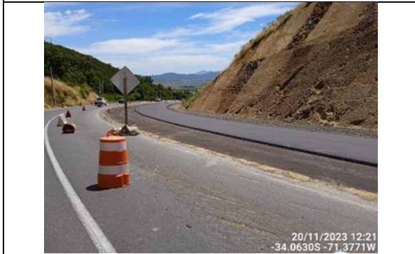
Dm 73.500 Faena de Pavimentación en Subida Cuesta San Vicente

-34.0687S -71.3670W Ruta 66 Santa Ines Las Cabras O'Higgins Chile