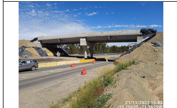
Dm 98.080 Pasarela Peatonal San Pedro