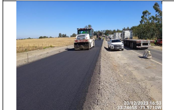
Dm 118.350 Pavimentación en Terraplén Sector Comuna Santo Domingo