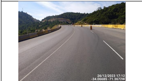
Dm 73.720 Ruta Pavimentada con Curva a la Izquierda