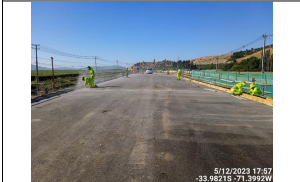
Dm 84.420 Entrada Puente La Cabaña