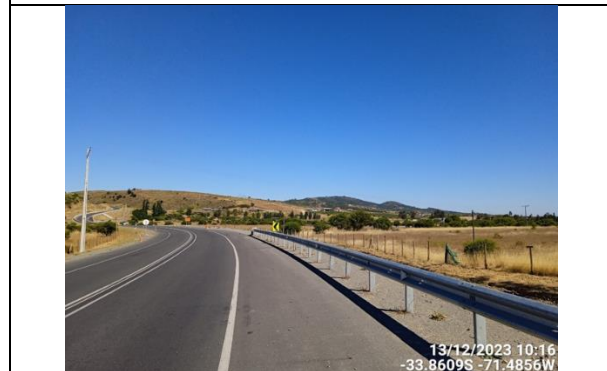
Dm 102.240 Panorámica Subida Paso Superior Quincanque