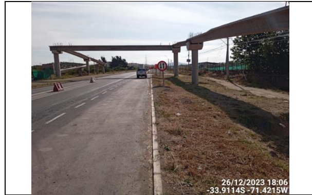
Dm 93.280 Pasarela Peatonal Liceo San Pedro