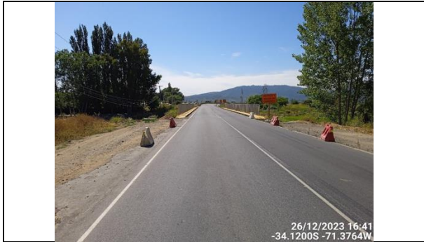
Dm 67.620 Entrada Puente Alhué