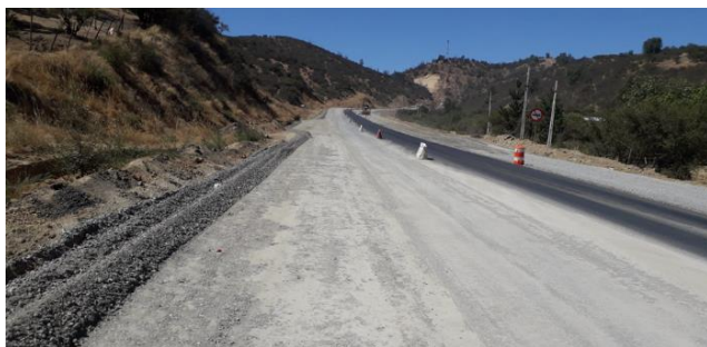
Base granular, Cuesta San Vicente