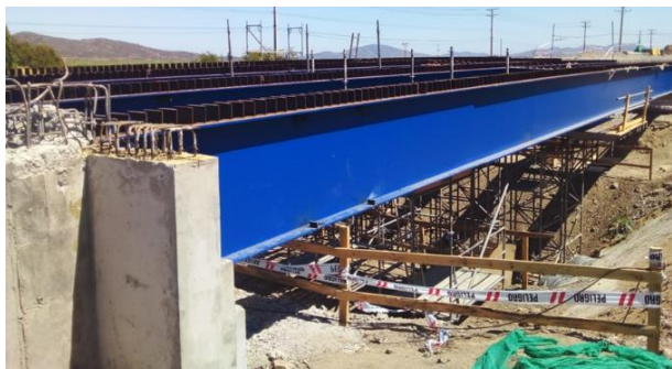
RMA Puente La Cabaña, Dm 84.460