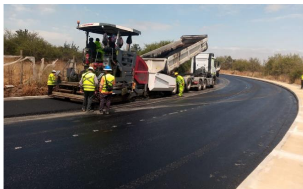
Concreto asfáltico de rodadura, eje 41 Variante Los Culenes