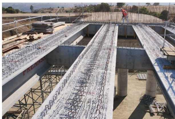
Paso Inferior Rapel, DM 116.950