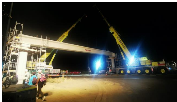
Pasarela Liceo San Pedro Dm 93.300