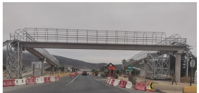
Pasarela Peatonal San Vicente, DM 76.800