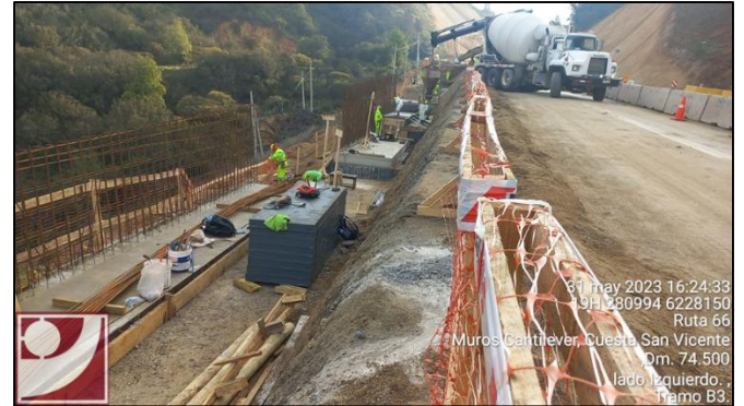
Muro Cantilever Dm 74.500