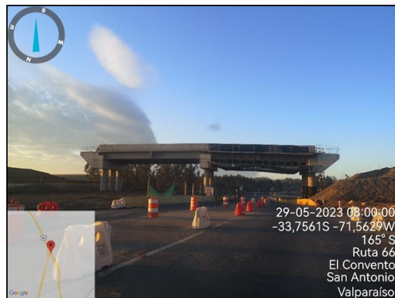
Encofrado Barreras de hormigón PI Rapel Dm 117.000