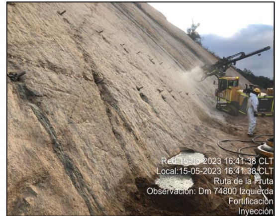
Sostenimiento de taludes Dm 74.800