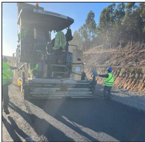
Concreto asfáltico capa intermedia Dm 107.100