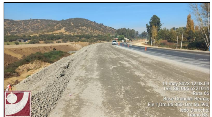
Base granular Dm 66.350 – 65.590