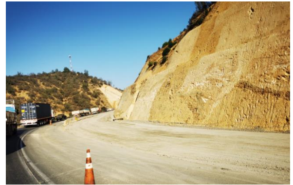
Terraplén y corte, Dm 74.880