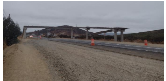
Pasarela Liceo San Pedro Dm 93.300