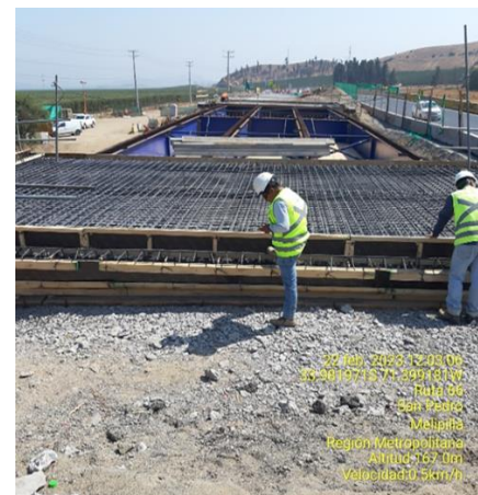
RMA Puente La Cabaña, Dm 84.460