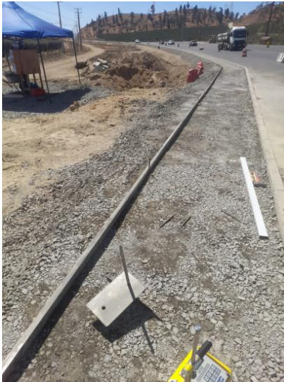
Construcción aceras, DM 84.900