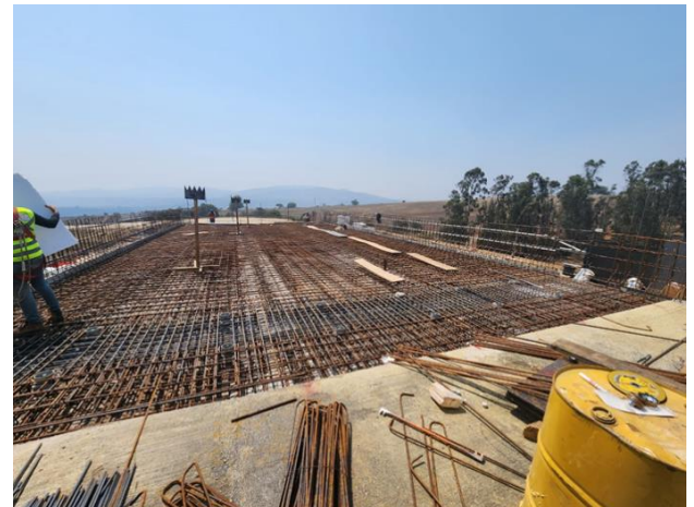
Paso Inferior Rapel, DM 116.950