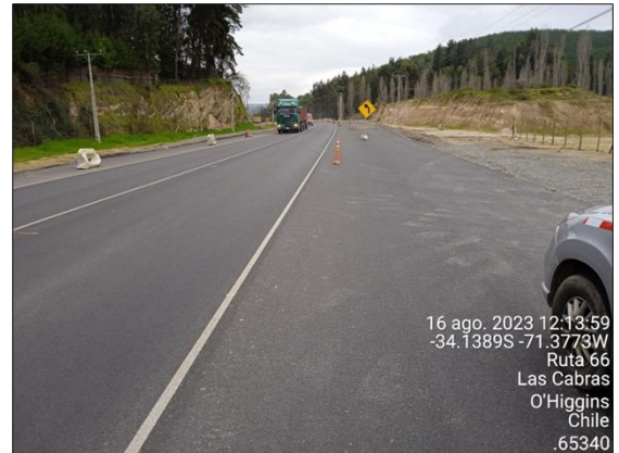
Dm 65.340 Zona con Pavimento Nuevo