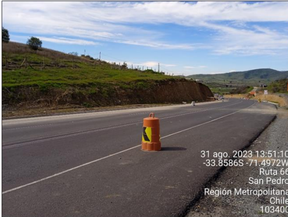
Dm 103.400 Curva con Asfalto Tipo Binder