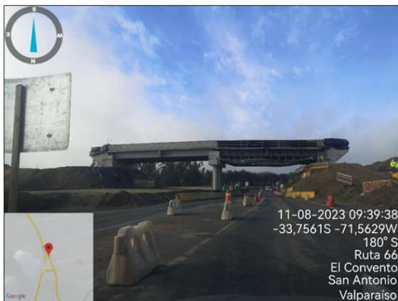
Dm 117.000 Paso Superior Rapel