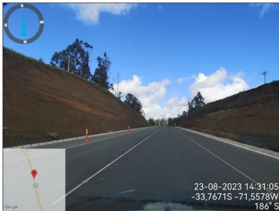
Dm 115.700 Plataforma de la Ruta, Terminada