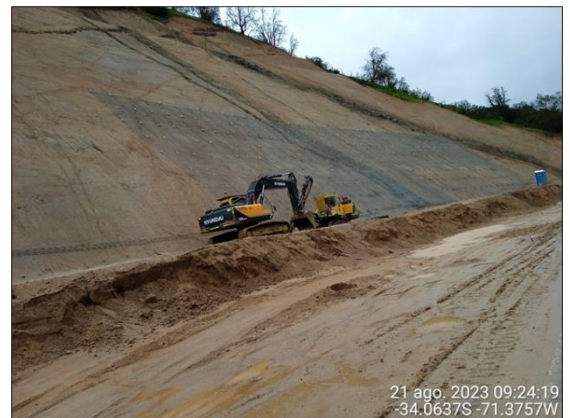
Dm 74.520 Faena Terraza y Fortificación de Corte. Lado Izquierdo