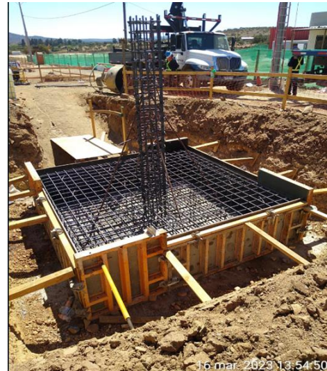
Pasarela Peatonal Escuela G-139