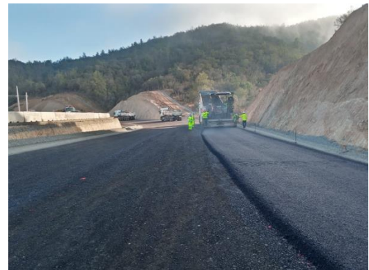
Concreto asfáltico capa intermedia Dm 73.600