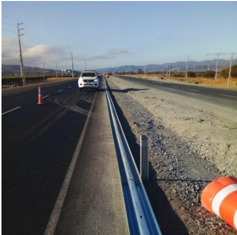
Instalación de barreras metálicas certificadas H2 (W5) Dm 91.000 aprox.