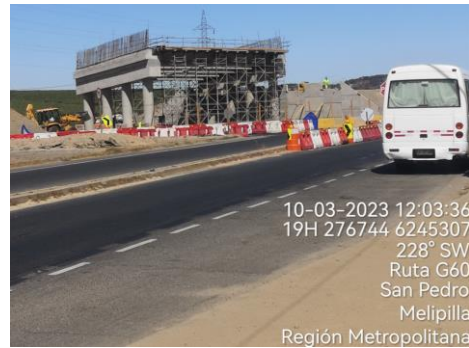
Paso Superior Las Arañas Poniente Dm 92.720