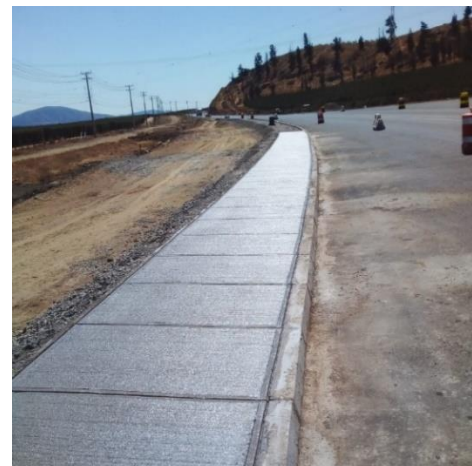
Construcción aceras Dm 84.900