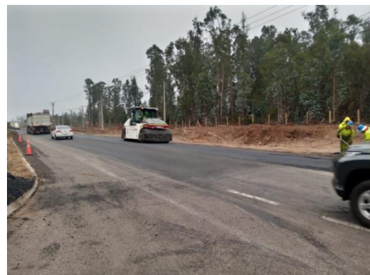
Rehabilitación de pavimento Dm 124.800