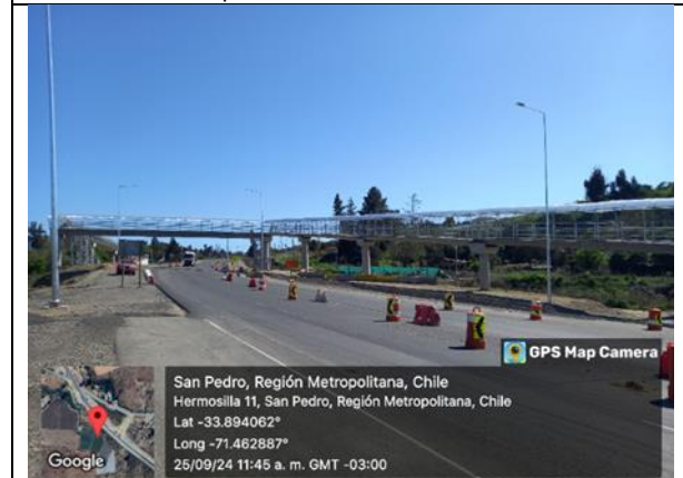
Pasarela San Pedro, Dm 98