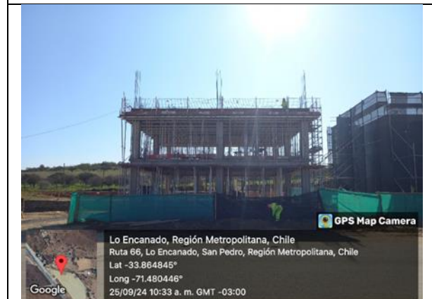
Edificio Inspección Fiscal en Área de Servicios