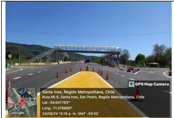
Demarcación, Dm 76,7