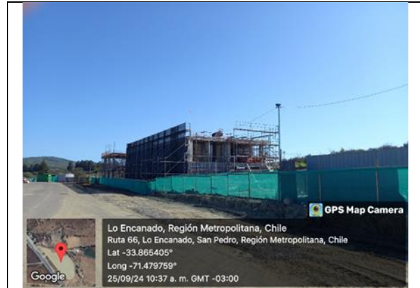
Edificio de administración en Área de Servicios