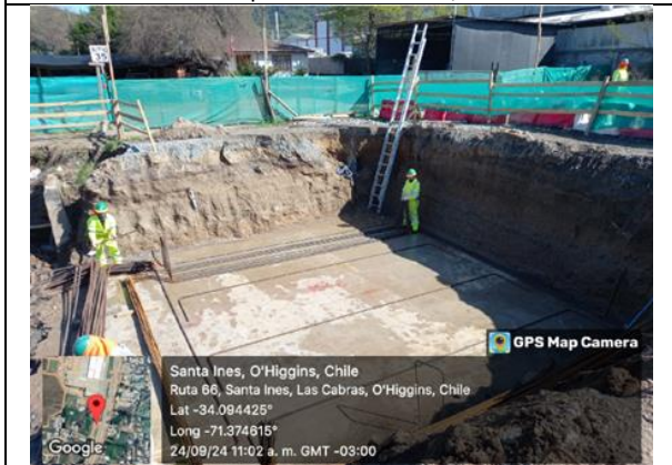
Pasarela peatonal Santa Inés, Dm 70,7