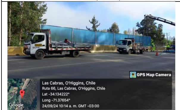
Instalación pantallas acústicas, Dm 65,9