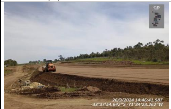
Terraplenes, Eje 7, Dm 132.000 Dm 132.140