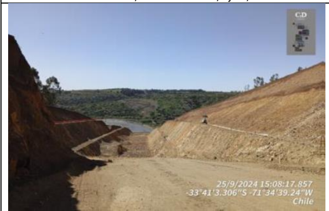
Eje 7, Dm 125.100 - Dm 125.200