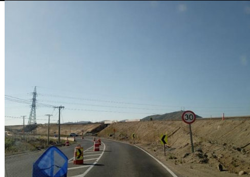
Dm 92.400 Terraplén Enlace Las Arañas