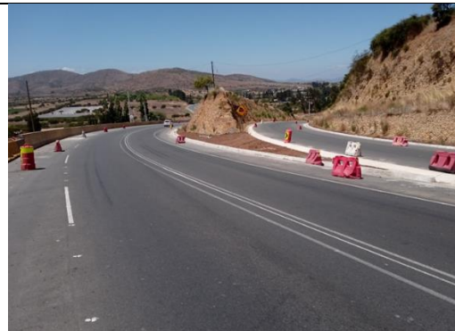
Dm 103.100 Acceso a Lo Encañado