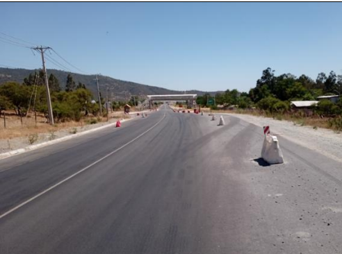
Dm 76.560 Proximidad Pasarela Peatonal San Vicente