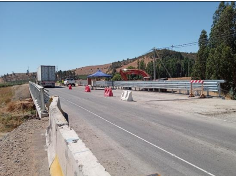
Dm 84.400 Entrada Puente La Cabaña