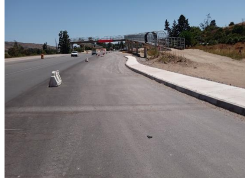
Dm 97.920 Pasarela Peatonal San Pedro