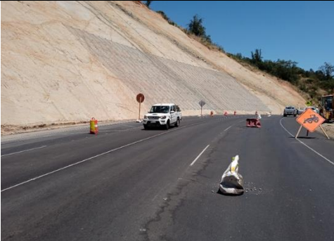
Dm 74.800 Corte Reforzado Cuesta San Vicente